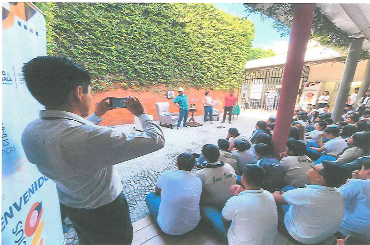
Público disfrutando la obra