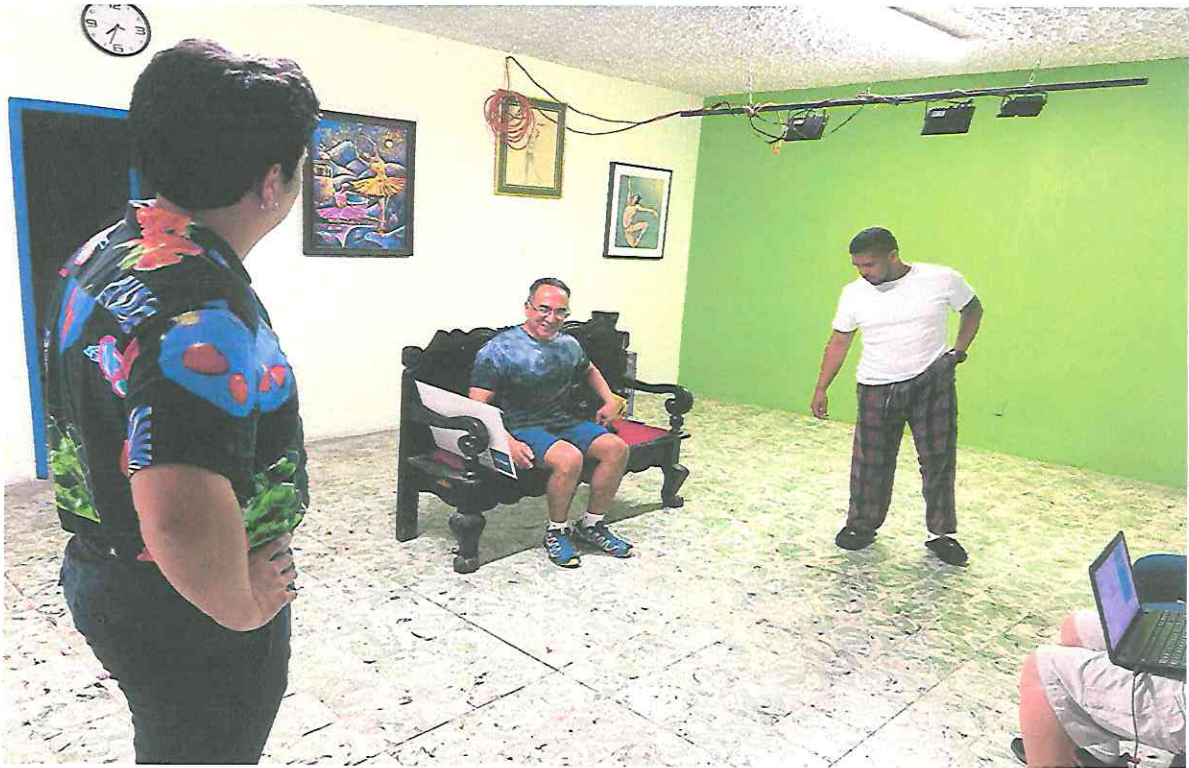
Ensayo de la obra