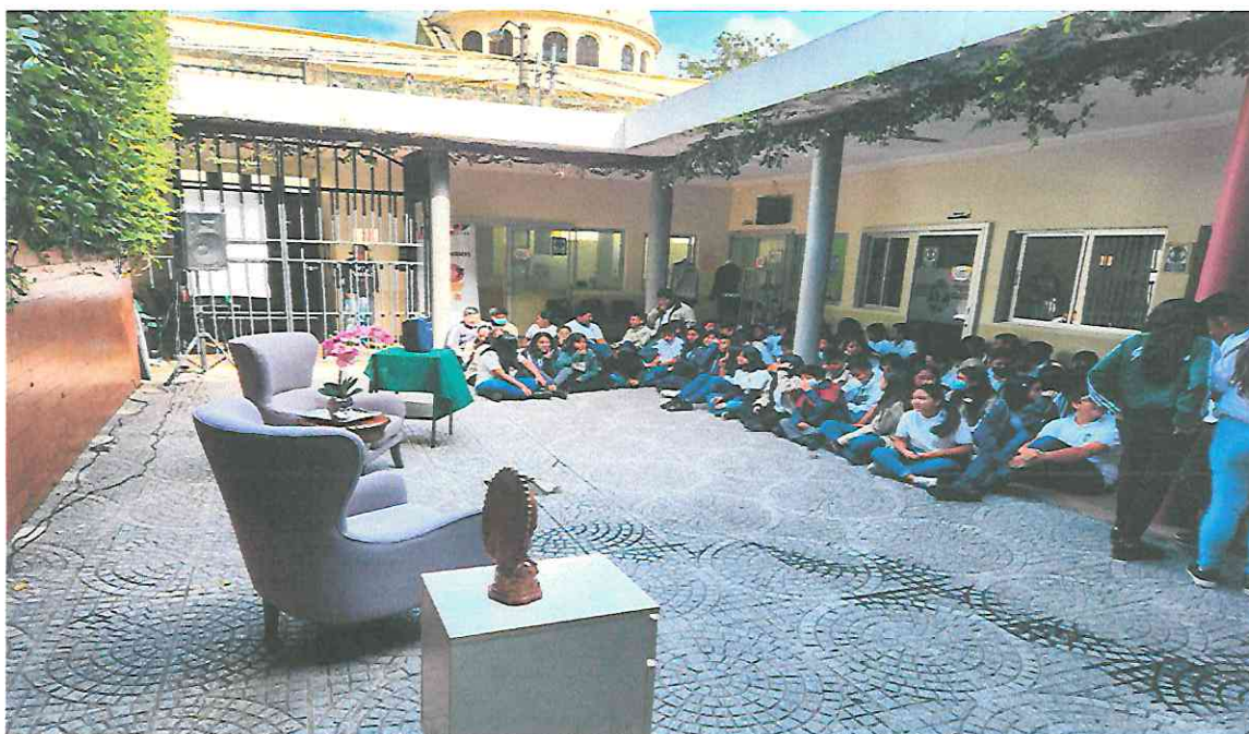
Primera Presentación Grados 5°. Y 6°. Primaria y Nivel Básico

La obra “Una Pareja de Tres”, se presentó a los grados de 5°. 6°. Primaria y Nivel Básico de Colegio Valverde.