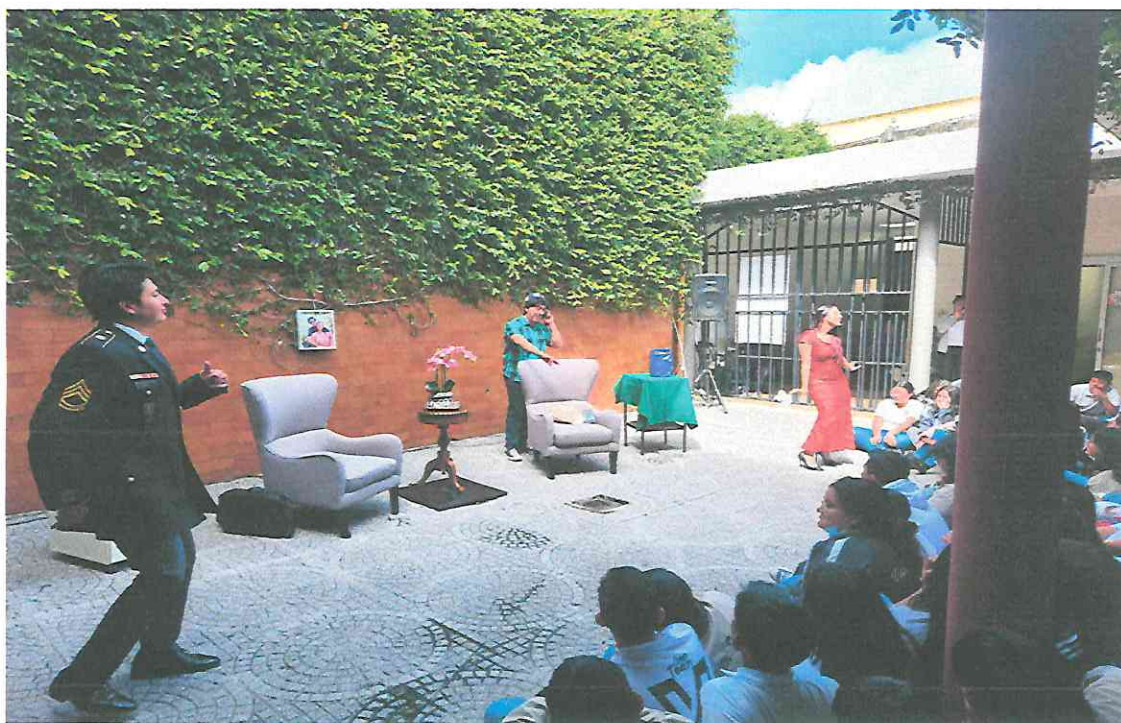
Presentación del Elenco