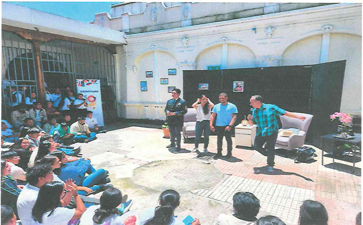
Elenco en la presentación