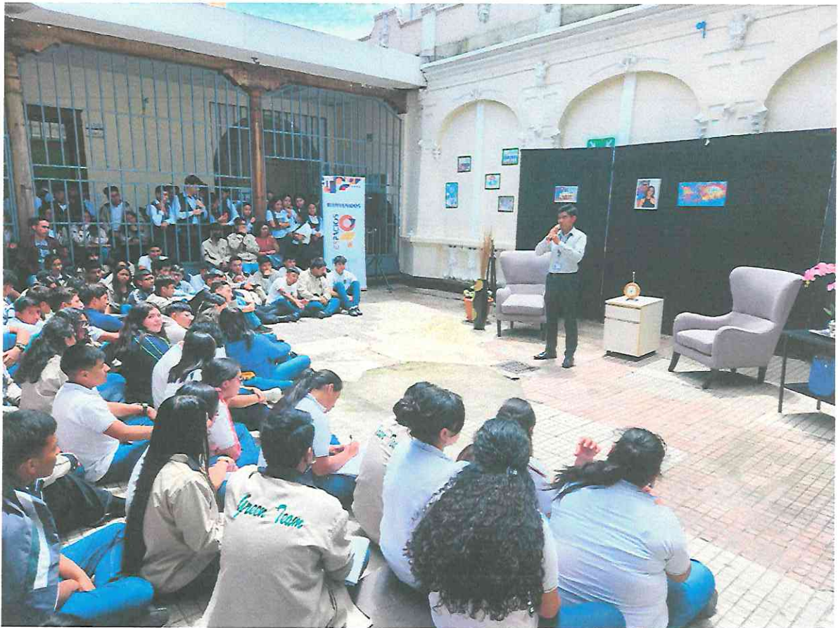
Público (Nivel Diversificado)

Presentación de la obra “Una Pareja de Tres”, a el Nivel Diversificado del Colegio Valverde