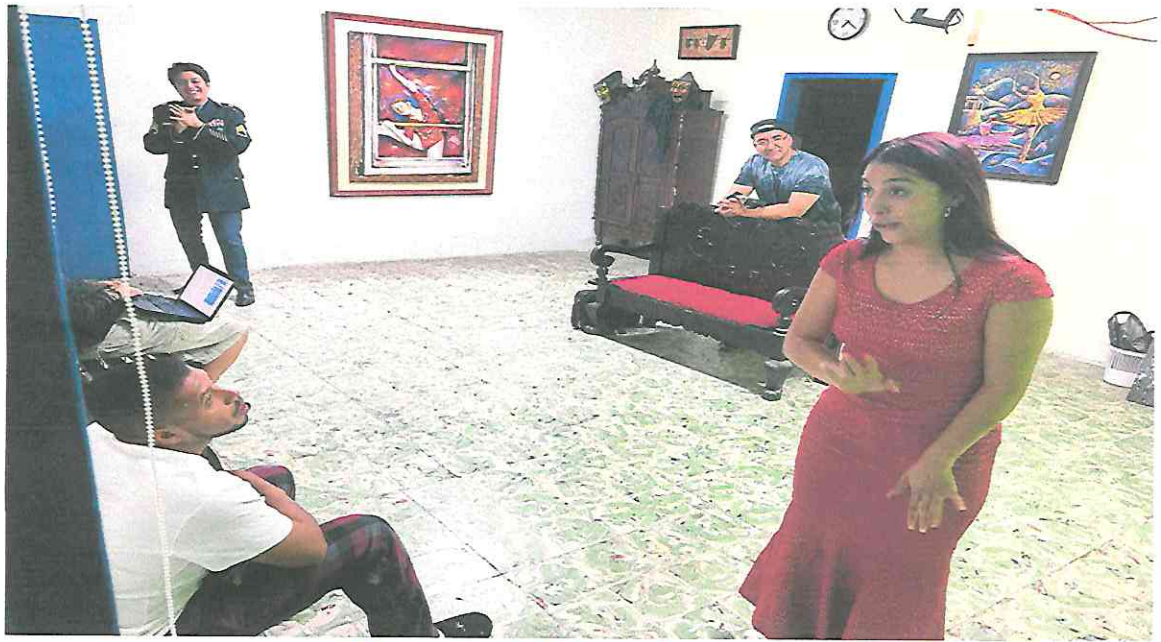
Ultimando detalles de la obra