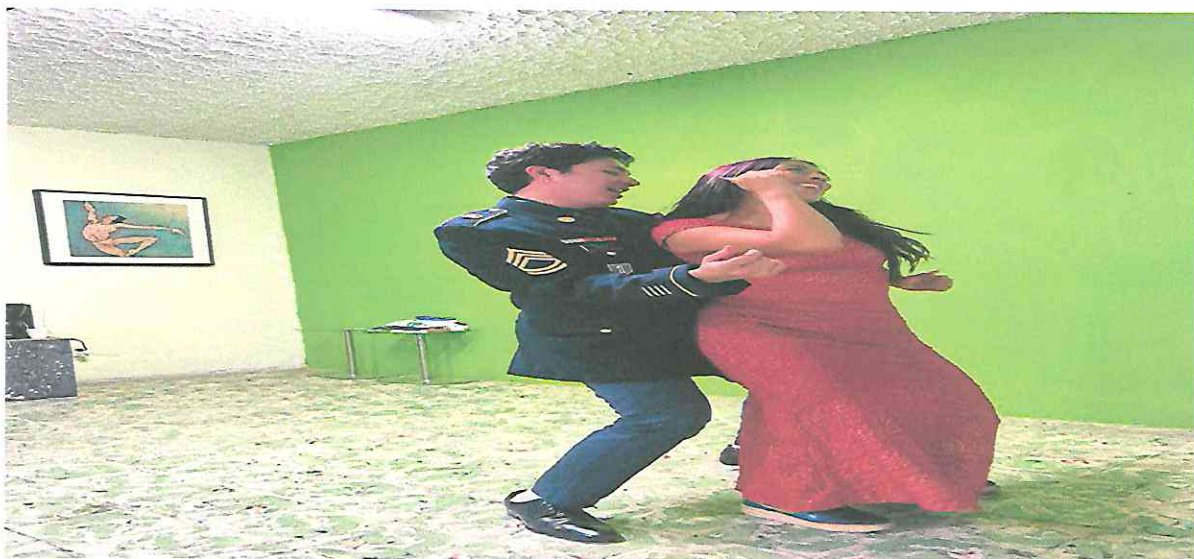
Ensayo con vestuario