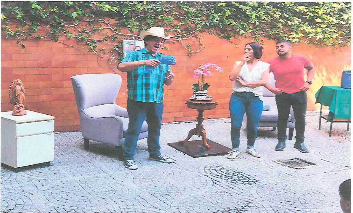
Participación del Elenco