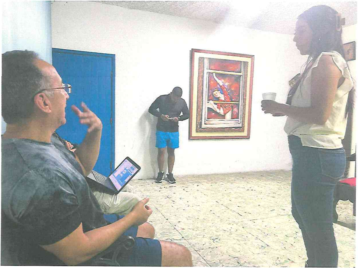
Marcando detalles en los ensayos