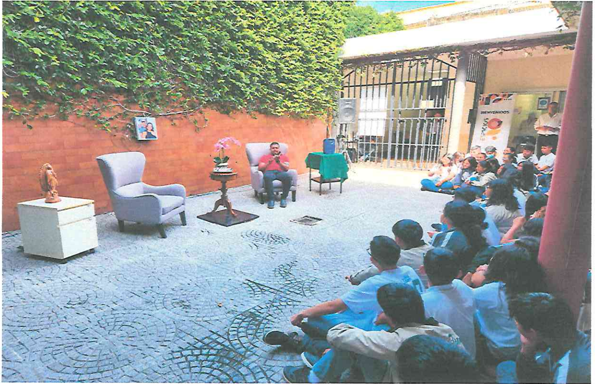
Presentación de la Obra "Una Pareja de Tres"