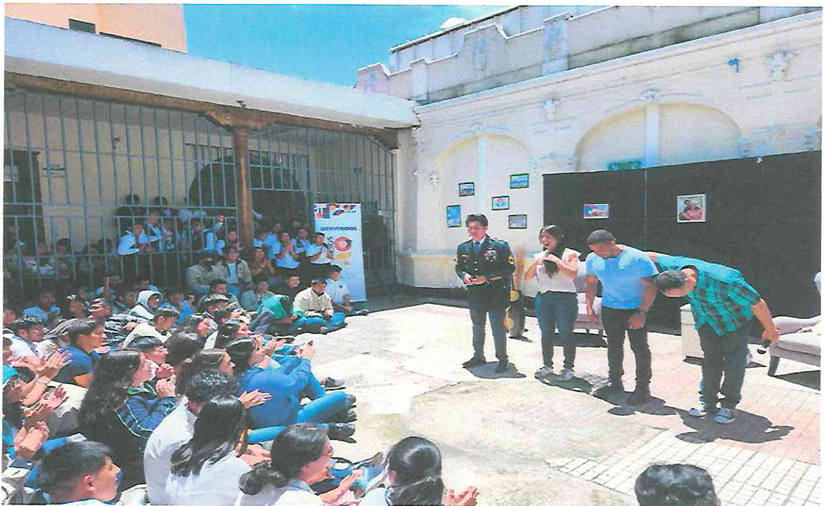
Final de la obra